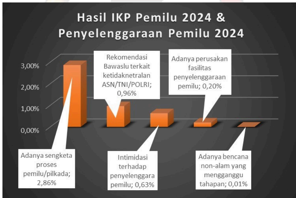
Grafik : Skor Indikator Kerawanan Pemilihan Tahun 2024

Bawaslu Kota Blitar telah mengambil langkah-langkah preventif dengan melakukan koordinasi intensif dengan KPU, pihak keamanan, serta instansi terkait lainnya. Fokus utama adalah menjaga integritas proses Pemilu, melindungi hak pilih masyarakat, dan memastikan setiap tahapan Pemilu berjalan sesuai dengan ketentuan yang berlaku.